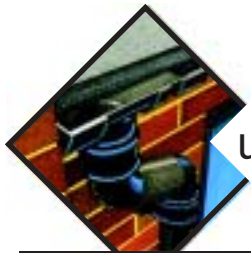
uszczelnienia odwodnień dachów, elementów kanalizacji oraz obróbek blacharskich,