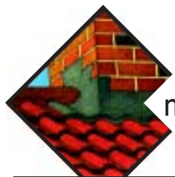
miejsca o skomplikowanych kształtach, podstawy kominów, wążów, świetlików, kalenice i kosze dachów,