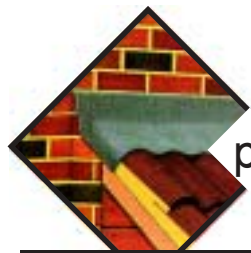
połączenie pokryć dachowych z murem,