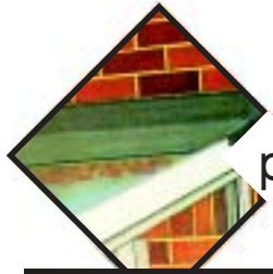
pokrycia szklarni, uszczelnienia okien mansardowych,

i inne, takie jak: uszczelnienia awaryjne w łodziach, przyczepach mieszkalnych, kontenerach i samochodach.